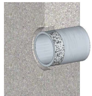
penetraciones de tubería

TIP: Al cincelar, no coloque el cincel en el interior de la canaleta. En lugar de eso, coloque el cincel en la superficie de concreto, a aproximadamente 25 mm (1 pulg.) por delante de la canaleta, y ejerza una presión directa con el cincel en dirección a la canaleta, de modo que el concreto que se va a desprender caiga en la canaleta. Cincele hasta llegar a una profundidad de 40 mm (1.5 pulg.) antes de continuar. Se ha comprobado que este método es más productivo, requiere menos esfuerzo y se tendrá una canaleta con la forma correcta.