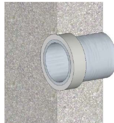
penetraciones de tubería

IMPORTANTE: Los productos Krystol deben estar protegidos contra el secado rápido y se deben mantener húmedos para que desarrollen plenamente sus propiedades. Cubra el Krystol Waterstop Grout con membrana de plástico o con una arpillera para mantener la humedad. Después de que el material ha fraguado, humedezca la superficie con agua para mantener los niveles de humedad durante 48 horas.